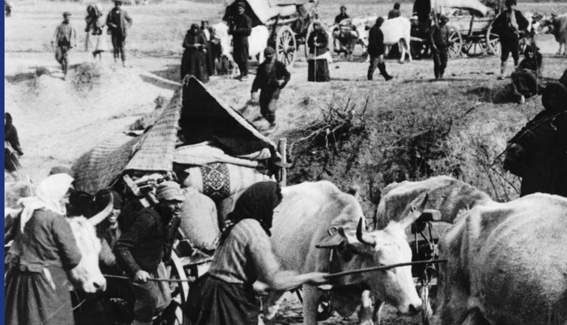
Griechische Flüchtlinge aus Smyrna, das 1922 von der türkischen Armee besetzt wird

Arbeitsmigration, Krieg und Okkupation sowie Wissensgründe sind hauptsächlich dafür verantwortlich, dass Menschen ihre Heimat verlassen. Schlaglichtartig beleuchtet die Ausstellung ausgewählte Einzelbeispiele von der Antike bis in die Gegenwart aus unterschiedlicher Sicht. Jedes Museum stellt Themen vor, in denen sich das Problem des Fremdseins niederschlägt. Diese Aspekte verdichten sich zur Gesamtansicht der Präsentation.